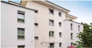
Wohnhaus Kölner Straße

Rösrath | seit 1998 | 23 Betreute in drei Gruppen für Menschen, die pflegerische und soziale Unterstützung brauchen