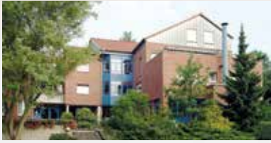
Wohnhaus Scharrenbroicher Straße

Rösrath | seit 1982 | 42 Betreute in fünf Gruppen auch für ältere Menschen, die pflegerische und soziale Unterstützung brauchen